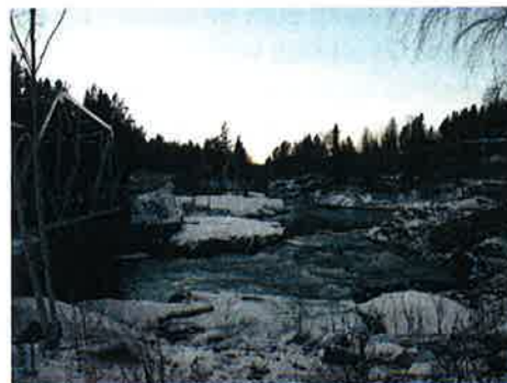
Figur 7-3 Bildet viser vannføring på 5,5 m 3 /s. Dette er representativt for middelvannføring etter utbygging, iflg Lancaster 2008:VIII