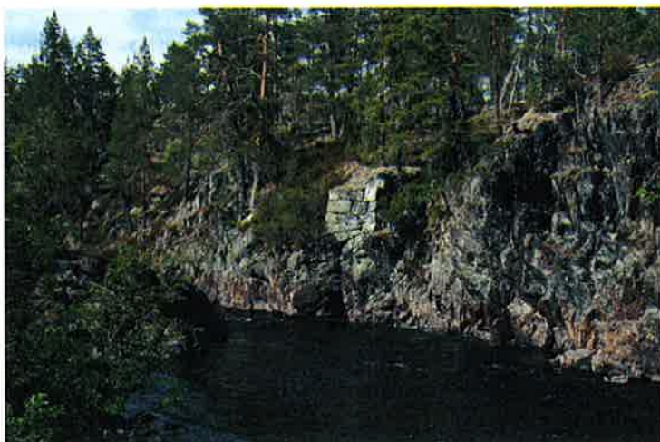
Figur 7-1 Tydelige rester etter brukar like nedstrøms utløpet ved Sønderlandsvatn. Disse kan bli indirekte berørt av dammen