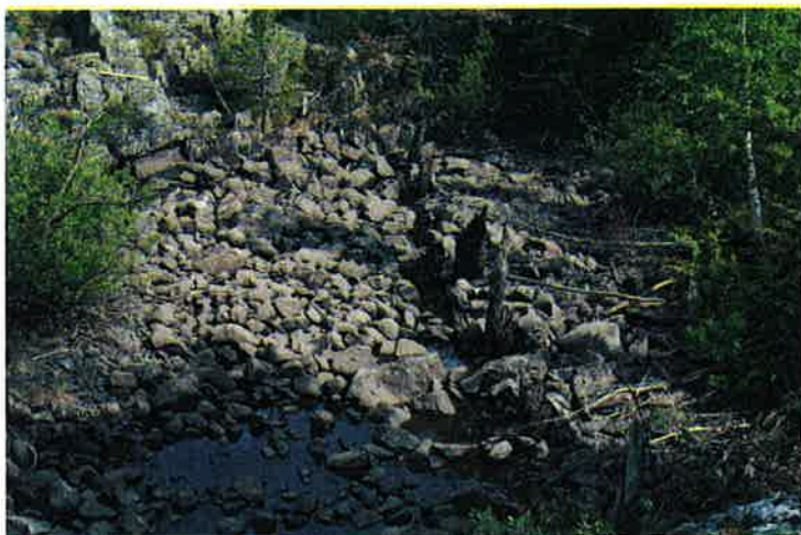
Figur 6-3 Rester etter elveforbygning ved utløpet av Sønderlandsvatn

I Skogså, like nedstrøms utløpet av Sønderlandsvatnet, står to sett brukar. De bevarte fundamentene er av tørrmurt hugget naturstein. De skal være bygget i henholdsvis 1880-årene og omkring 1911. Langs sørvestsiden av Sønderlandsvatnet er det fortsatt rester etter en eldre vegtrasé. Veggen er bygd av tørrmurt naturstein, kledd delvis med naturstein og delvis med hugget stein. Langs vegkanten står stabbestein. Vegtraséen er en del av kjørevegen mellom Sauland og Sønderlandsbru som stod ferdig i 1880-årene. I utløpet av Sønderlandsvatnet står rester etter en elveforbygning som ble bygget i årene 1890-1911. Nåværende vegtrasé er fra 1946. (Kilde: Aase 1989).