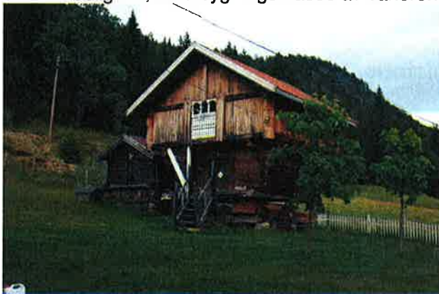
Figur 6-2 Automatisk fredet loft på Skårdal

Gårdene på elvesletta er ofte av yngre dato skilt ut fra hovedgården som husmannsplass eller som eget bruk. I undersøkelsesområdet har rekketun og firkanttun vært mest utbredt fram til begynnelsen av 1900-tallet. Utskiftningene i andre halvpart av 1800-tallet og stadig behov for nye boliger har imidlertid bidratt til at denne strukturen ofte er oppløst. En rekke eldre loft/buer er fortsatt bevart omkring på gårdstunene. Flere av disse er automatisk fredete, altså bygget før 1537. I dag karakteriseres bebyggelsen av tettstedet Sauland, spredte gårder, boligfelt og enkelte bolighus, med bygningsmasse av varierende alder.