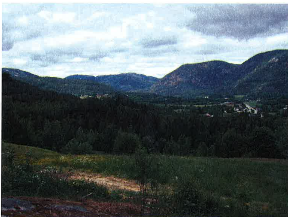
Bilde 5-1: Oversiktsbilde som viser det overordnede landskapet i Hjartdal. Bildet er tatt fra Tømmermoen, like sørøst for Sauland sentrum, mot vest.

Den østvestgående Hjartdal som er hoveddaldraget i kommunen, har bratte og høye sider i nord. I sør er sidene slakere og rundere i formene. Tuddalsdalen, som er en sidedal til Hjartdal, har en roligere karakter når vi ser på hovedformene. Her er begge dalsidene relativt slake og skogkledde. Barskogen er svært dominerende i begge dalførene.