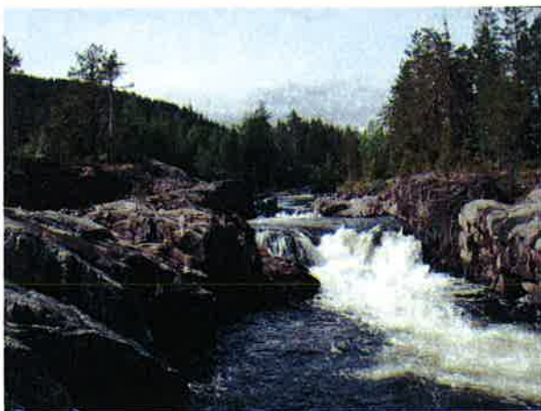
Bilde 5-2: Skogsåa har flere små fosser og stryk. Bildet er tatt et stykke ned for utløpet av Sønderlandsvatn, like før Skogsåa løper sammen med Grovaråa.

Områdets overordnede landskap er svært kupert og preges av daler som omkranses av små og storkuperte åser og heilandskap. Vassdragene preges av store innsjøbasseng. Hjartsjø i Hjartdal og Sønderlandsvatn i Tuddalsdalen er eksempler på dette. Hjartdøla som er hovedelva i undersøkelsesområdet slynger seg rolig gjennom landskapet. Skogsåa i Tuddalsdalen har et mer varierende løp med flere fosser og stryk.