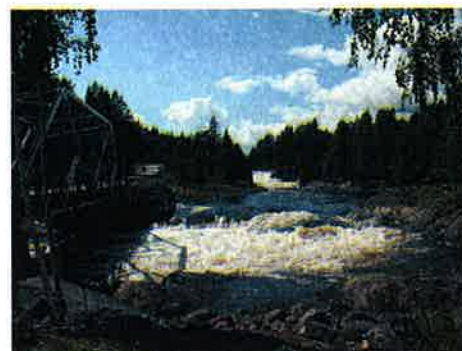
Figur 7-4 Bildet viser vannføring forbi Heddal mølle på 65,7 m 3 /s. Dette er en vannføring som fortsatt vil forekomme i flomperioder, også etter utbygging, iflg Lancaster 2008:VIII.