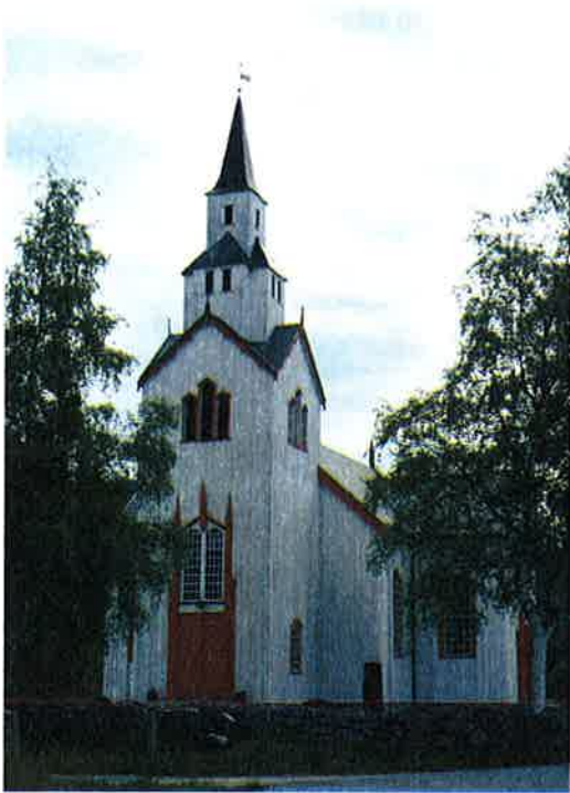
Figur 6-6 Sauland kirke er fra 1850, men står på et kirkested fra middelalderen

men her er også bebyggelse fra begynnelsen av 1900-tallet, da gårdene hadde utviklet seg til en grend med skysstasjoner, gjestgiversteder og skjenkestuer. På Kleppen lå lensmannsgården og våket over grenda.