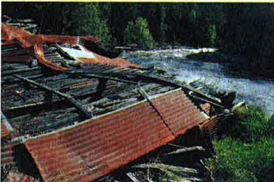
Figur 6-4 Den gamle sagan ved Hanfoss

På Rinde, et stykke nord for Brekka, er det registrert spor etter en skytebane med anvisergrav med dekkvoll og kulefanger. Standplassen var nede ved brua ved nåværende E 76. Her skal også ha vært et skytterhus. De to strukturene er begge av tørrmurt naturstein og var delvis utrast i 1988. (Kilde: Aase 1988:8).