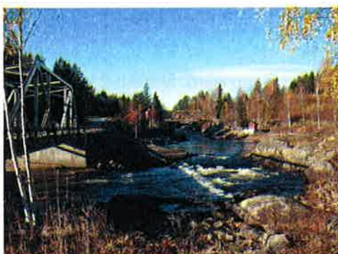
Figur 7-3 Bildet viser vannføring forbi Heddal mølle på 11,5 m 3 /s.