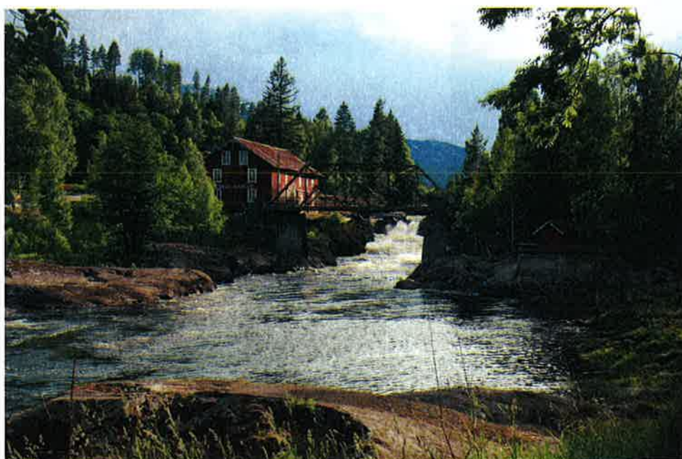
Figur 6-5 Heddal mølle ved Omnesfossen er Hjartdal kommune sitt tusenårssted.

butikker, skole og flere boliger utover fabrikkboligene. Driften opphørte i 1917, men Heddal kommune kjøpte fallrettigheter, tomten og bygningene. Fabrikken ble omgjort til mølledrift noen år etter dette og har siden hett Heddal mølle ( www.hjartdalthistorelag.no ). Mølla var i drift til 1960-tallet. Side-bygningen til fabrikken ble bygget som korn tørke på 1950-tallet og var i bruk helt fram til 1980-tallet. En eldre bru fra første halvdel av 1900-tallet er i dag en naturlig og viktig del av kulturmiljøet, selv om den er noe yngre enn den eldste fabrikk- og møllevirksomheten på stedet. Heddal mølle har i dag status som Hjartdal kommunes tusenårssted. Området er regulert til spesialområde bevaring og blir ivaretatt av en egen stiftelse (pers. meddelelse, F. H. Skoje). Både bygningene, fossen og brua er viktige enkeltlementer i dette kulturmiljøet.