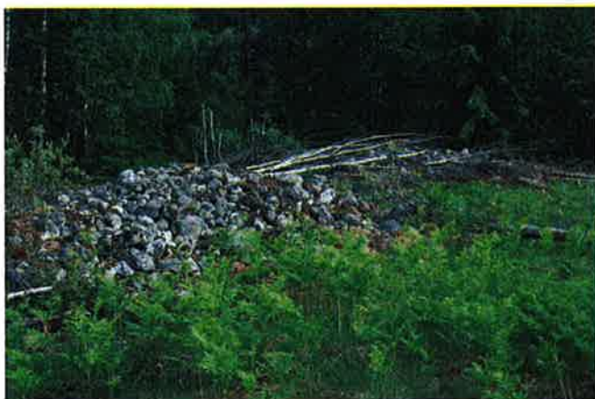
Figur 6-1 Rydningsrøyser på Moen

Steinalderfunn i Telemark tyder på at de eldste bosetterne har hatt en stor aksjonsradius og trolig vandret sesongvis mellom kysten og fjellområdene. Det er særlig langs de store vassdragene at det er funnet spor etter denne pionerbosetningen. To meisler i flint som er funnet henholdsvis ved Omnesfossen og på Moen, og et mulig kølleemne med påbegynt skafthull på Frøland tyder på at også vassdragene i influensområdet ble brukt i steinalder. Funnt fra jernalder er mange og varierte og tyder på en gradvis ekspanderende gårdsbosetning i store deler av undersøkelsesområdet. Det er registrert gravhauger, eller spor etter gravhauger, både langs Skogsåa og Hjartdøla. Bosetningsekspansjonen ser ut til å ha foregått gjennom hele jernalderen og videre inn i middelalderen, inntil Svartedauden la en demper på bosetningsveksten i området omkring midten av 1300-tallet. Fangstanlegg på Moen like ved Hjartdøla samt mulige dyregraver på Frøland og ved Kvitåa i Tuddalsdalen viser at også ressursene i utmarken ble benyttet. En mulig kullgrop som er registrert like ved utløpet til Kvitåa, og myrjernbrenning i Grunningdalen under Frøland kan indikere at det også har foregått jernframstilling i området.