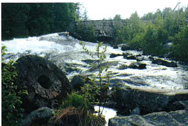
Figur 1-1 Nedstrøms Omnesfossen