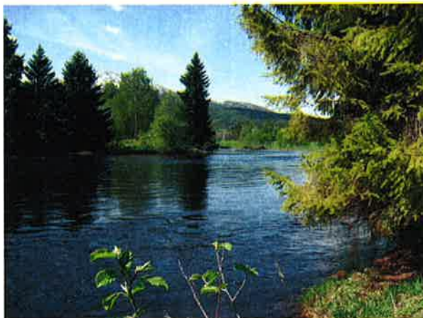
Bilde 5-3: Hjartdøla ved Åmot. Elva slynger seg rolig gjennom landskapet.

Vegetasjonen i undersøkelsesområdet er sterkt preget av barskog. Det er særlig gran som er framtrepende, men det vokser også mye furu i området. I lavereliggende områder, eksempelvis langs Hjartdøla, er det også tydelig innslag av løvtrær som bjørk og selje.