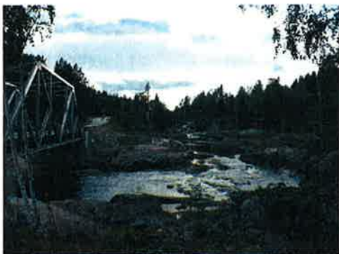
Figur 7-2 På bildet er vannføringen 2,7 m 3 /s, altså tilnærmet allminnelig lavvannføring (2,5 m 3 /s), iflg Lancaster 2008:VIII. Dette vil også gjelde etter utbygging av Sauland kraftverk.