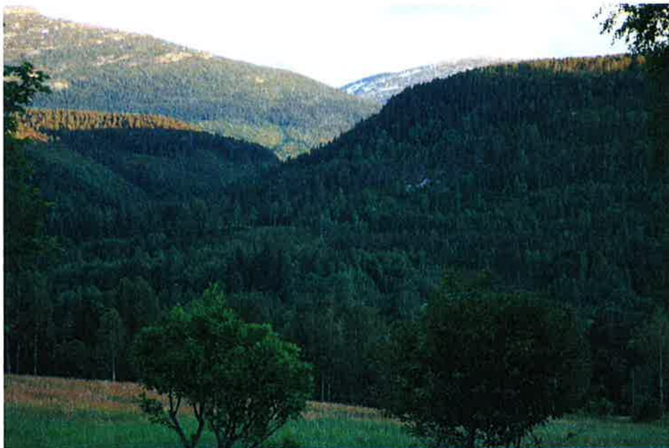
Figur 7-5 Utsikt fra tunet på Skoge. Tippet vil ligge i den treløse skråningen midt på bildet.